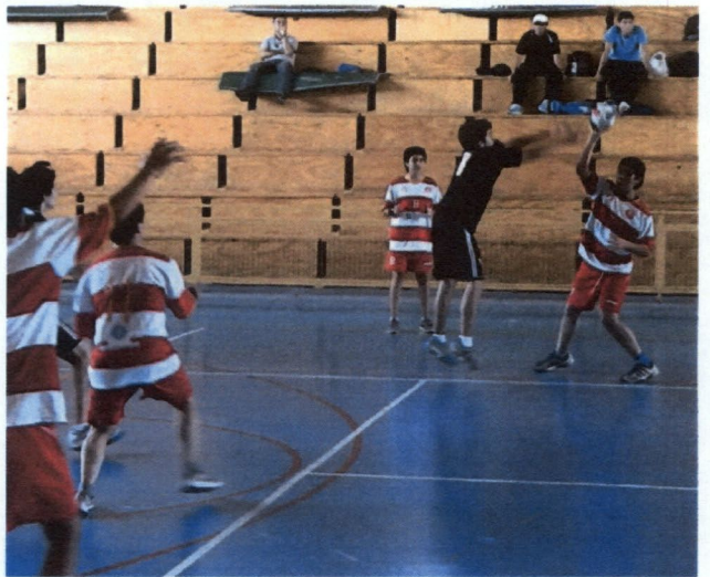
El cuadro capitalino de La Salle demostró a lo largo del certamen superioridad sobre sus oponentes y se alzó con el título en forma invicta.